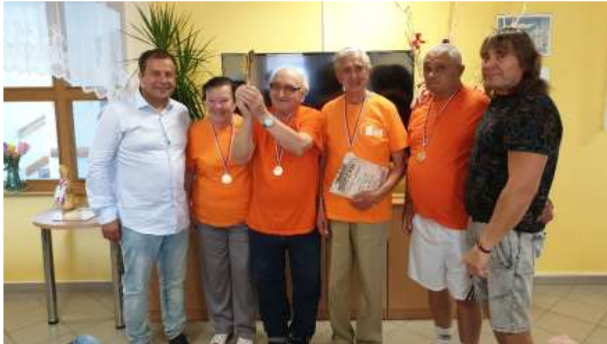
Vítězný tým: Domov pro seniory Brno Věstonická

Po přečtení básně jsme se odebrali ke společnému focení v zahradě a poté jsme se rozešli zpět do našich domovů.