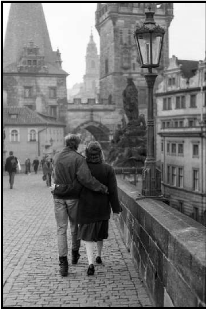
Obr. Praha, pohled do ulic, r. 1986