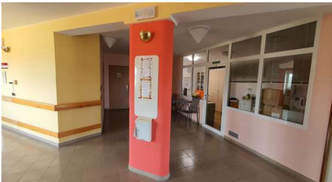
Chodba ve 3. podlaží, kancelář vedoucího sociální péče a vedoucí zdravotní péče, pracoviště sociální péče