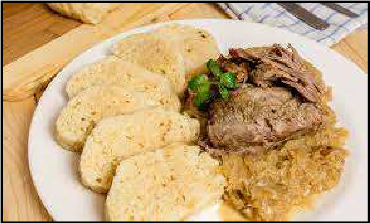
Obr. Vepřo - knedlo - zelo, Česká republika 😊